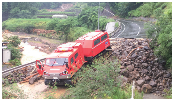
全地形対応車

航空小隊は、ヘリコプターのホイスト等により、陸上からの救助が難しい孤立地域における住民の救助活動を行い、孤立した福祉施設で要救助者16人を救助するなど、派遣期間中に19人を救助しました。また、消防庁ヘリ5号機（高知県消防航空隊運航）のヘリサットシステムを活用し、上空からの効果的な情報収集活動を実施しました。