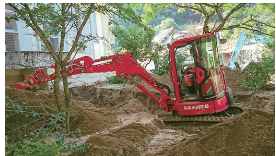
重機を活用した捜索活動

東峰村においては、緊急消防援助隊は、内閣府の革新的研究開発推進プログラム（ImPACT）において研