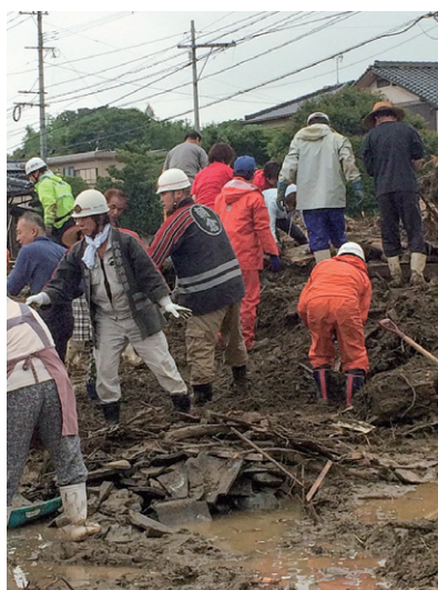
朝倉市消防団の活動