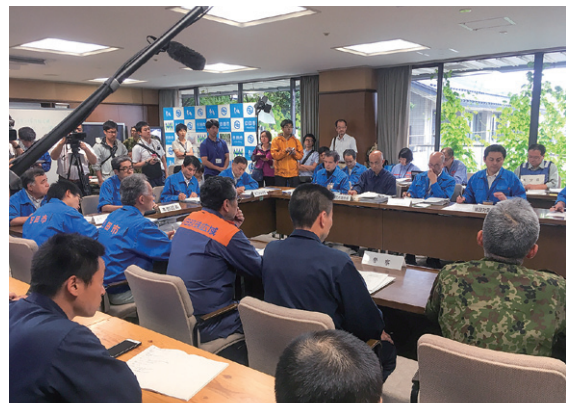
消防応援活動調整本部（大分県庁）

福岡市消防局指揮支援隊は、大分県庁に設置された消防応援活動調整本部に部隊長の属する指揮支援隊として参集し、大分県、大分県内消防本部及び消防庁派遣職員のほか、警察、自衛隊、海上保安庁、DMAT、気象庁、国土交通省等の関係機関とも連携し、被害情報の収集・整理や、緊急消防援助隊の活動管理等を行いました。また、二次災害の発生を防止するため、降雨による活動中止判断の基準を明確にし、指揮支援隊長を通じて各県大隊長に周知を行いました。