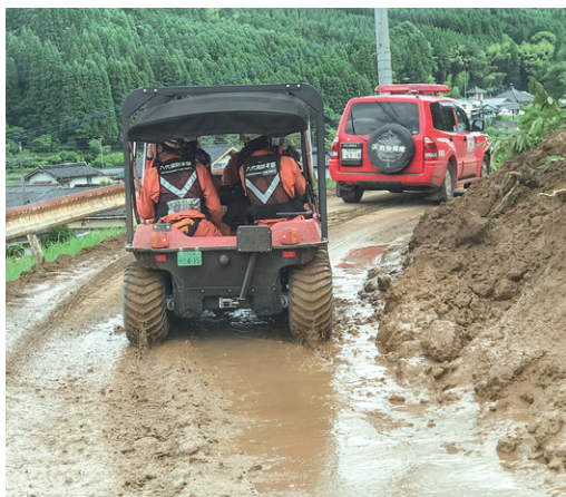
バギーを活用した検索活動

中津市及び日田市においては、河川の氾濫や土砂崩れにより発生した孤立地域に、水陸両用バギーなども活用しながら進入し、安否確認を含め捜索・救助活動を広範囲に実施しました。さらに、愛知県大隊の全地形対応車が、土砂等が堆積した道路障害も乗り越え、孤立地域への効率的な進入を図りました。