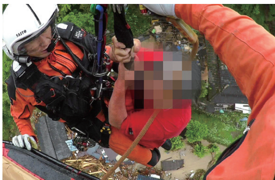
ホイスト救助

航空小隊は、上空からの効果的な情報収集活動を実施するとともに、ヘリコプターのホイスト等により、陸上からの救助が難しい孤立地域における住民の救助活動を行いました。朝倉市では、7月7日に複数のヘリコプターを機動的に活用し孤立地域から23人を救助するなど、派遣期間中に24人の救助を行いました。また、陸上隊と航空小隊が連携し、進入困難な孤立地域や到着に長時間を要することが見込まれた地域において、ヘリコプターにより隊員を投入し、救助活動を行いました。