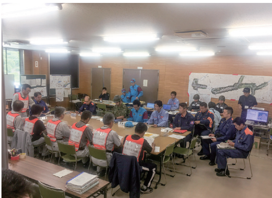
指揮支援本部（朝倉市役所）

また、筑後川流域や有明海においても、地元消防機関、警察及び自衛隊と連携し、大規模な一斉捜索を実施しました。