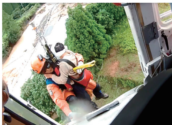
ヘリコプターのホイストによる

航空小隊は、ヘリコプターのホイスト等により、陸上からの救助が難しい孤立地域における住民の救助活動を行い、孤立した福祉施設で要救助者16人を救助するなど、派遣期間中に19人を救助しました。また、消防庁ヘリ5号機（高知県消防航空隊運航）のヘリサットシステムを活用し、上空からの効果的な情報収集活動を実施しました。