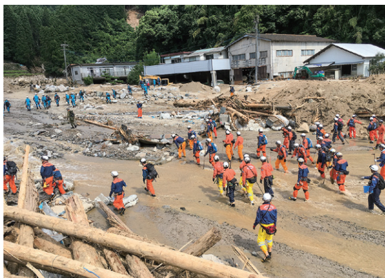
河川の一斉捜索

航空小隊は、上空からの効果的な情報収集活動を実施するとともに、ヘリコプターのホイスト等により、陸上からの救助が難しい孤立地域における住民の救助活動を行いました。朝倉市では、7月7日に複数のヘリコプターを機動的に活用し孤立地域から23人を救助するなど、派遣期間中に24人の救助を行いました。また、陸上隊と航空小隊が連携し、進入困難な孤立地域や到着に長時間を要することが見込まれた地域において、ヘリコプターにより隊員を投入し、救助活動を行いました。